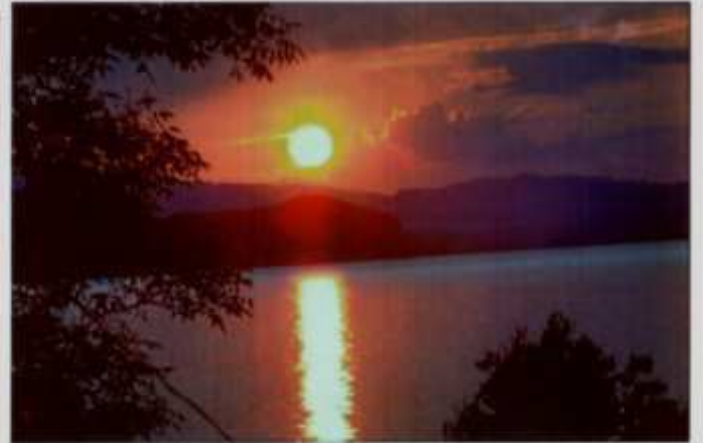
Der Sonnenuntergang am abend war schön