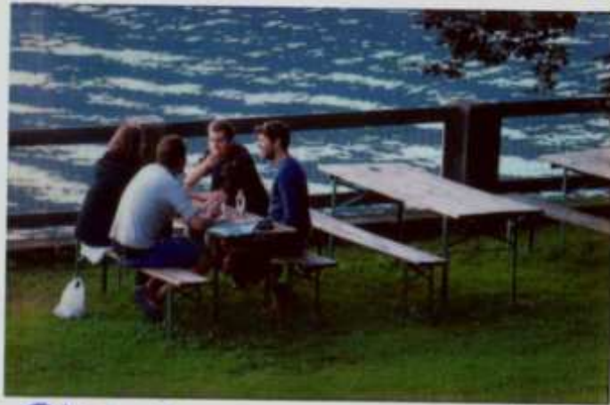
Die Leiter machten eine Sitzung für den Nächsten Tag.