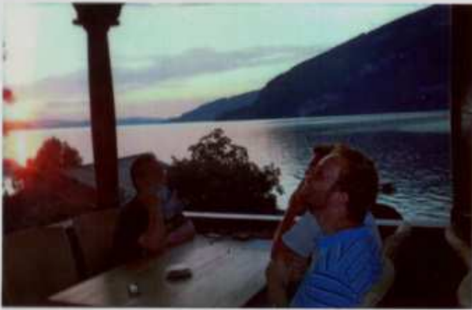
Ein Paar sind an chillen