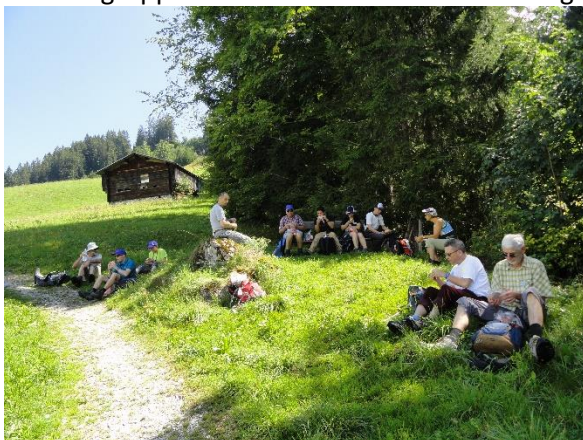
Picnic-Platz unterwegs nach Gstaad

Nach dieser Wanderung bildeten wir die Wandergruppen 'Geniesser' und 'Schmetterlinge'