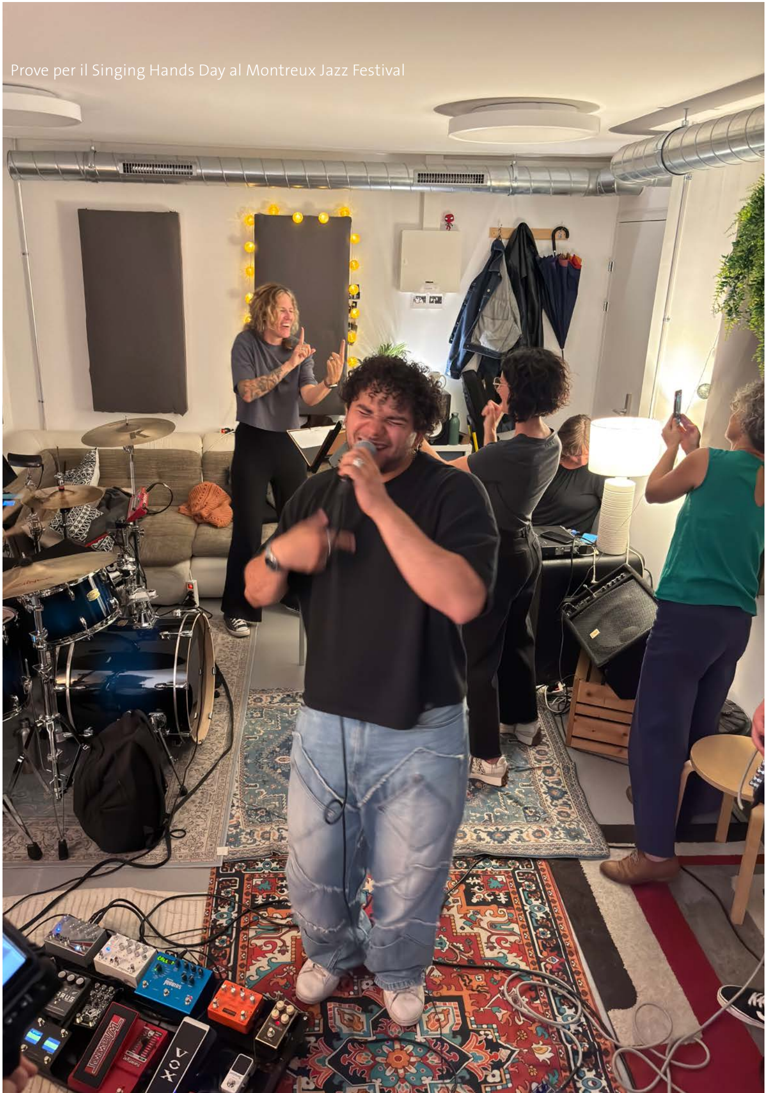
Prove per il Singing Hands Day al Montreux Jazz Festival