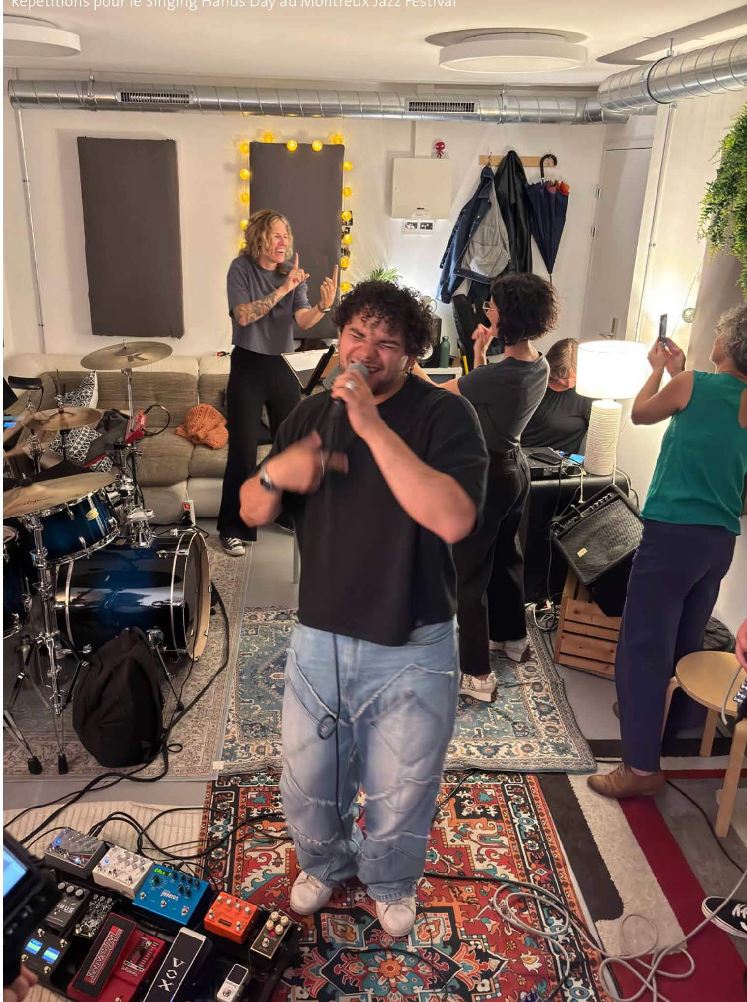
Répétitions pour le Singing Hands Day au Montreux Jazz Festival