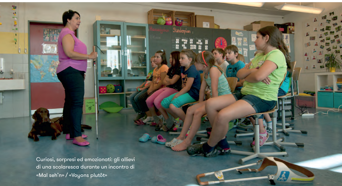
Curiosi, sorpresi ed emozionati: gli allievi di una scolaresca durante un incontro di «Mal seh'n» / «Voyons plutôt»

Informazioni su «Mal seh'n» / «Voyons plutôt» si trovano all'indirizzo: www.malsehn.ch / www.voyonsplutot.ch