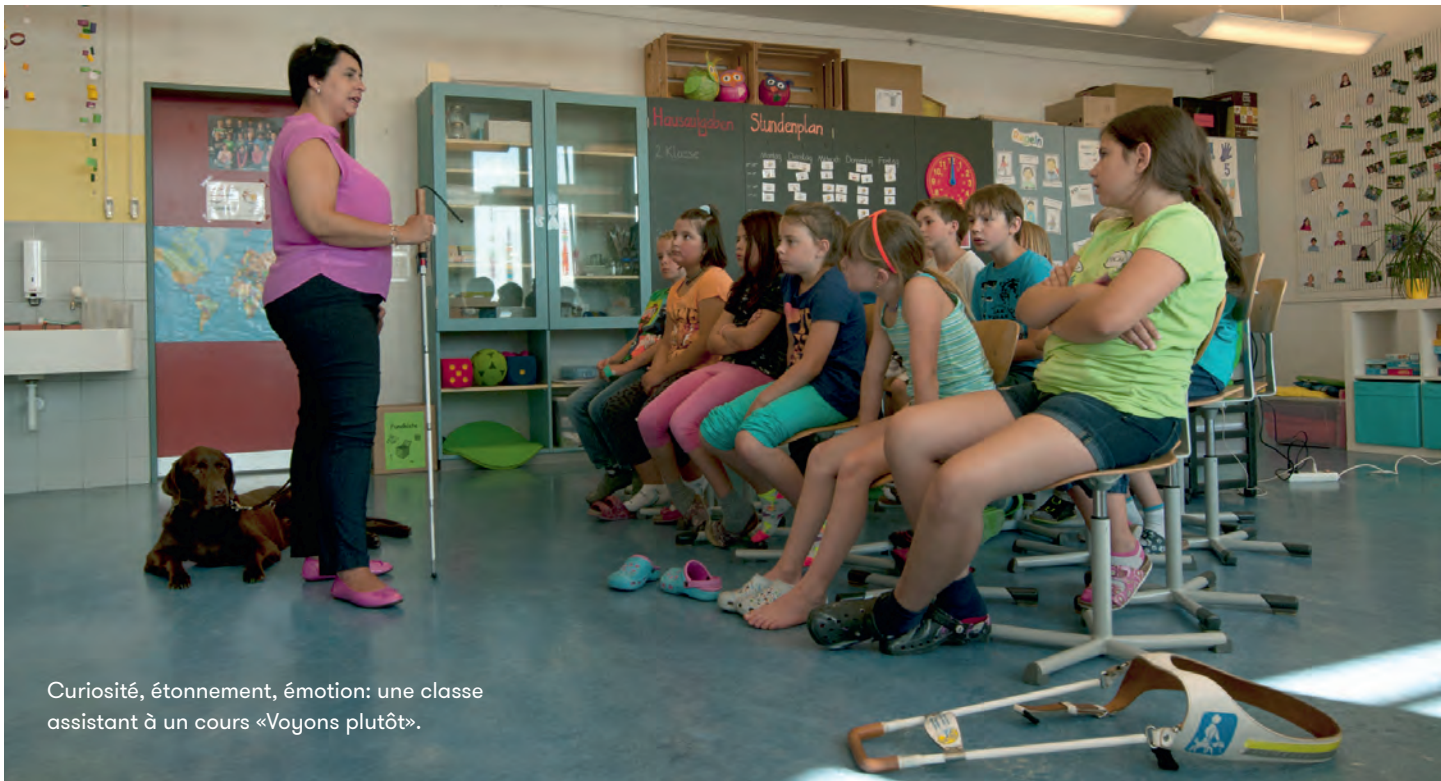
Curiosité, étonnement, émotion: une classe assistant à un cours «Voyons plutôt».

Pour plus d'informations sur «Voyons plutôt»: www.voyonsplutot.ch . Pour les écoles publiques de la 2 e à la 9 e classe (4 e -11 e selon HarmoS), une séance est gratuite par école et par classe.