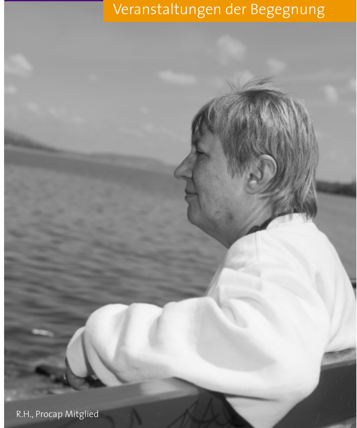
R.H., Procap Mitglied

Procap organisiert Anlässe und Veranstaltungen der Begegnung